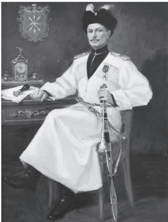
Гетьман Павло Скоропадський (1873–1945)