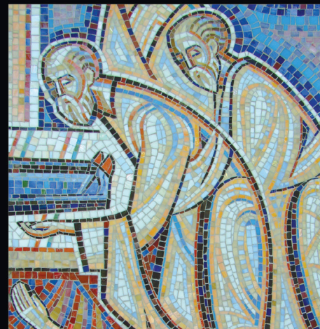
Фрагмент мозаїки Художник Баламаджі Павло Іванович