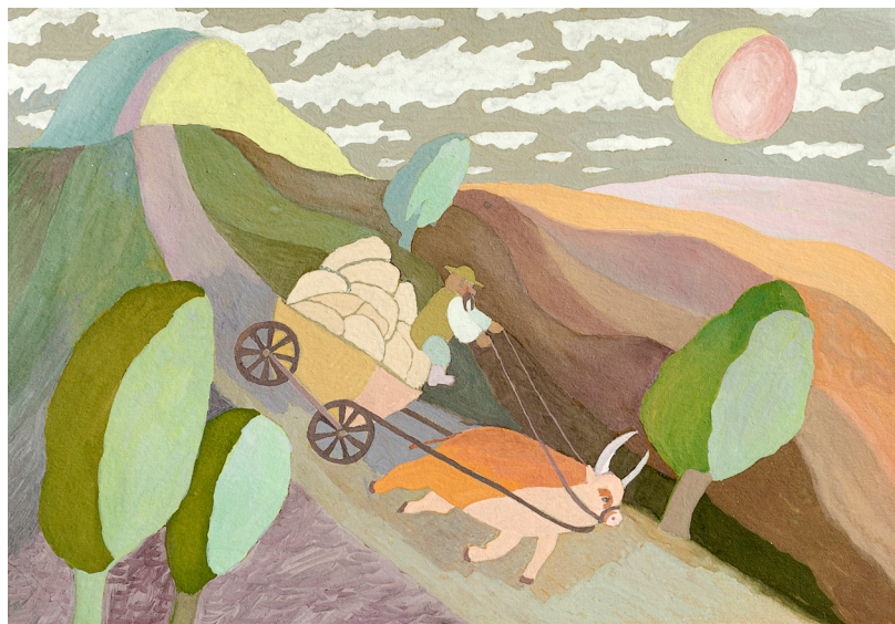
Котилася торба з великого горба. 2008 Папір, гуаш. 25x40