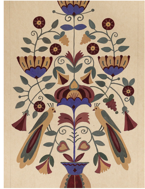
Серія робіт «Пісні України». 2010 Гуаш, папір. 40x25