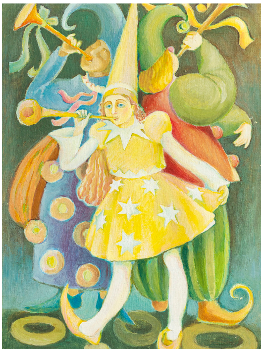
Ярмарок веселоців. 2005 Картон, олія. 50x30

Художниця-викладачка. Проживає у с. Тарасівка Київської області. Закінчила художньо-графічний факультет Одеського педагогічного інституту ім. К. Д. Ушинського (1977 р.). За направленням працювала учителькою малювання у школах м. Боярка та Будинку піонерів. Нині викладачка образотворчого мистецтва у Києво-Святошинському районному центрі творчості молоді «Оберіг». Учасниця всеукраїнських виставок.