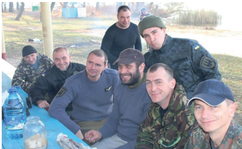
Осінь 2014. Після занять у навчальному таборі добровольці відпочивають на березі Дніпра