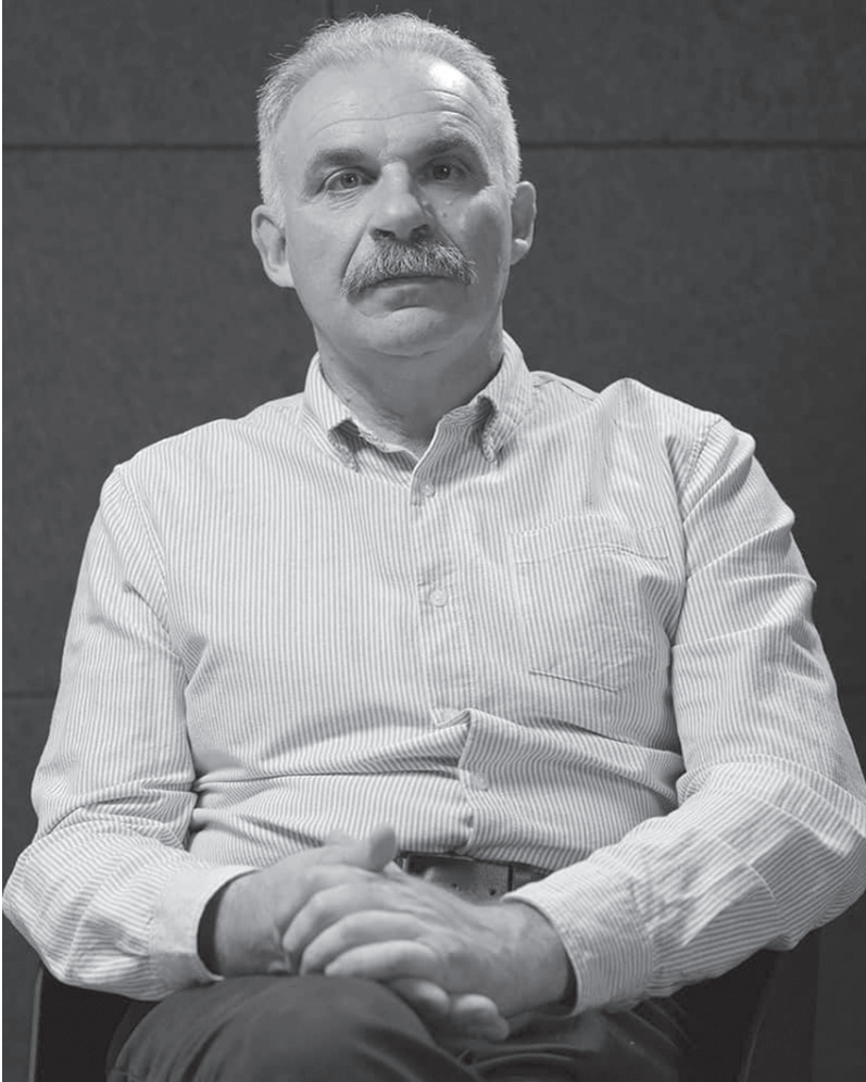
Віктор Єленський, релігієзнавець, голова Державної служби етнополітики і свободи совісті