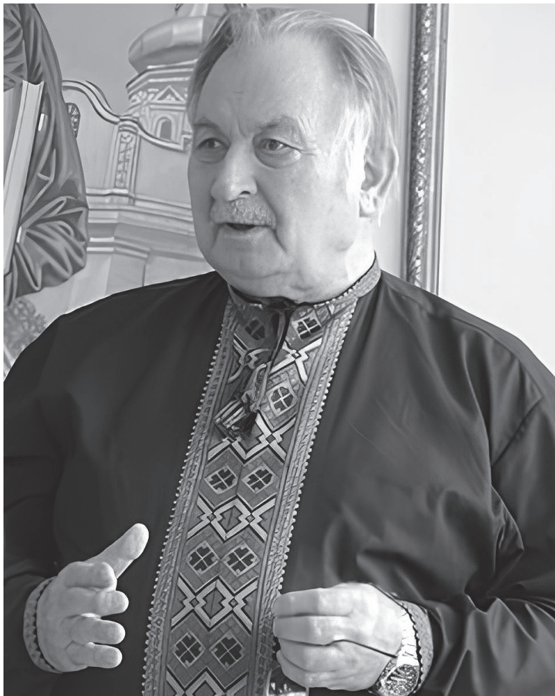
Анатолій Колодний, релігієзнавець, президент Української Асоціації релігієзнавців