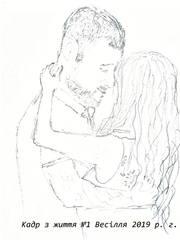
Кадр з життя №1 Весілля 2019 р. г. Пін Іван