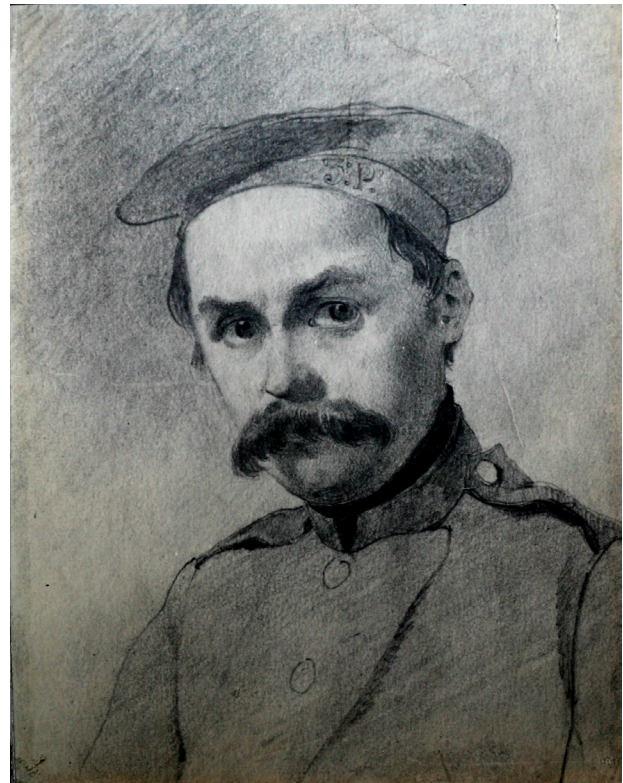
Т. Шевченко. Автопортрет. Папір, олівець. 1847.

АВТОПОРТРЕТ 1847 (папір, олівець, 12,7 × 9,9) Шевченко виконав 23 черв. — не пізн. 11 груд. 1847 в Орську. Зберігається у НМТШ (№ г—910). Зображення закомпоновано на невеликому аркуші, близькому до розміру поштового конверта. Це дає підстави вважати, що портрет намальовано саме для А. Лизогуба й надіслано разом із листом від 11 груд. 1847, у якому йдеться: «Ви питаєте, чи покину я малювання. Рад я