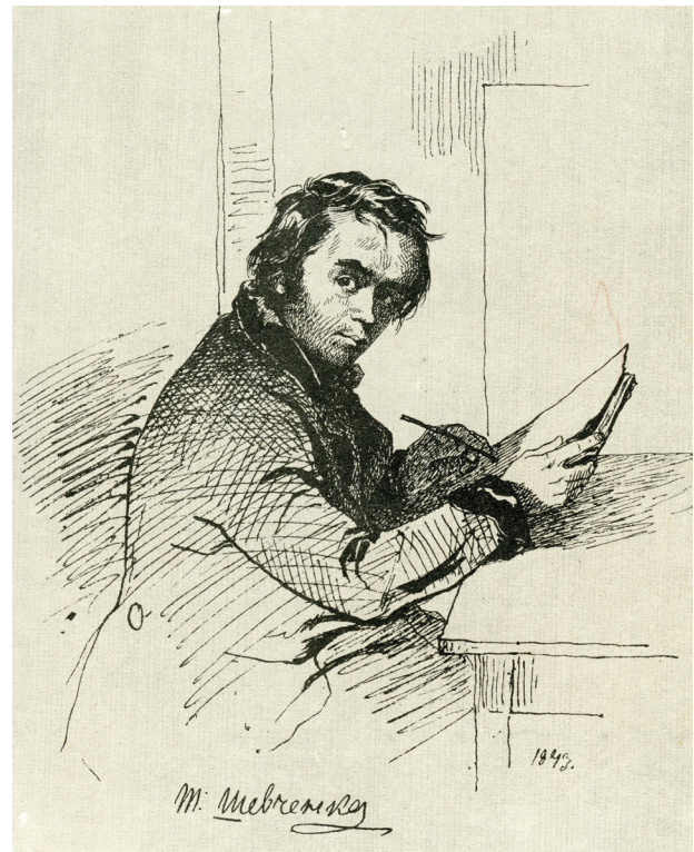
Т. Шевченко. Автопортрет Папір, туш. 1843

Художник намалював портрет, перебуваючи в полоні дум та образів щойно завершеної і присвяченої В. Репніній поеми «Тризна», яку дослідники називають «епіко-ліричною поемою-портретом» (Смілянська В. Образ автора в поемі Шевченка «Тризна» // НШК 26 . С. 70). В. Репніна в листі до Ш. Ейнара від 27 січ. — 1/13 берез. 1844, опубл. 1914 М. Гершензоном, розповіла,