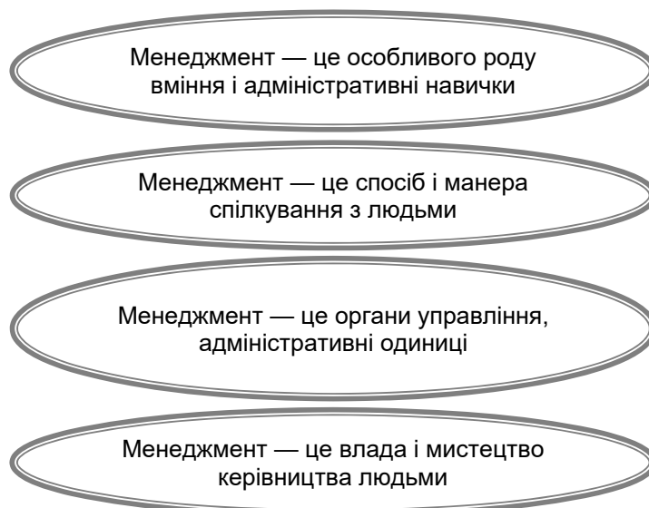
Рис. 1.1. Підходи до визначення поняття «менеджмент»

Провідні вітчизняні і зарубіжні фахівці в галузі менеджменту дають таке тлумачення поняттю категорії менеджменту (рис. 1.1):