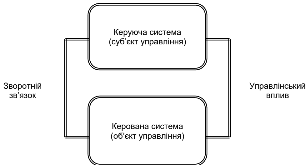
Рис. 1.3. Прямий і зворотній зв'язок між керуючою системою і керованою підсистемою

Слід мати на увазі і те, що менеджмент як основна складова процесу управління, забезпечує регулювання і координування дій всіх учасників, членів організації (персоналу). Без ефективного менеджменту практично неможливо досягти поставлених цілей перед організацією.