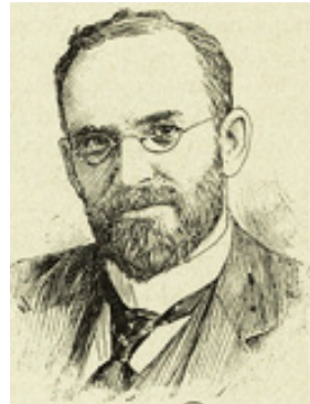
М. Дьюї (1851-1931)

Хто ж такий Мелвіл Дьюї? Дуже цікава і талановита людина. Американець. Навчаючись у Амхерстському коледжі, на його логічні здібності звернула увагу дирекція