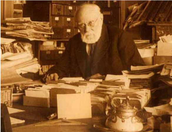
Поль Отле (1868-1944)

Міжнародний бібліографічний інститут (Institut international de bibliographie).