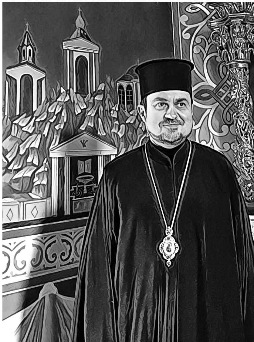
Єпископ Іларіон (Рудник)