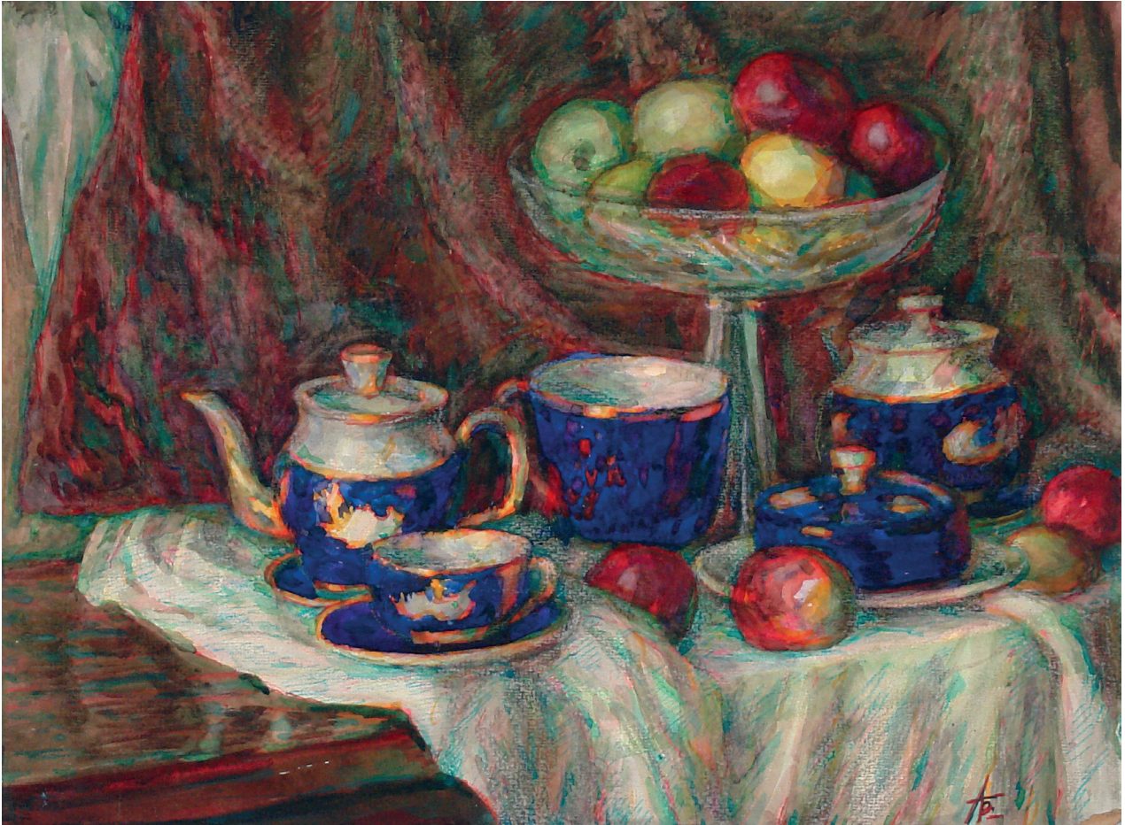
Мал.2. Натюрморт із сервізом. Папір, мішана техніка 2000 р.