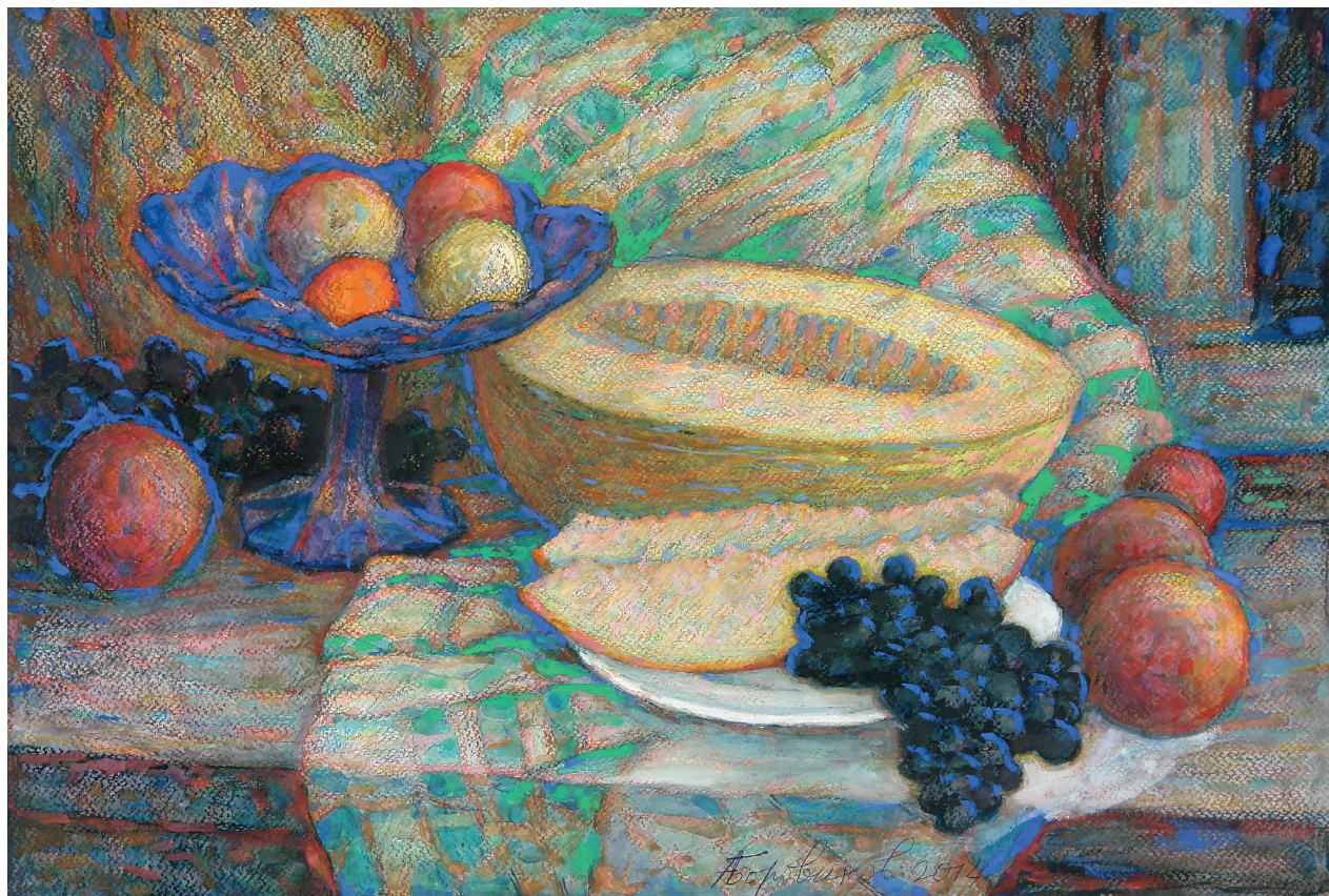
Мал.3. Натюрморт із синьою вазою. Папір, мішана техніка 2014 р.