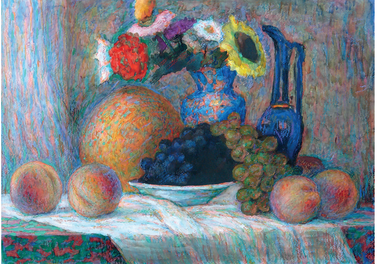
Мал. 1. Натюрморт з персиками. Папір, мішана техніка 2003 р.